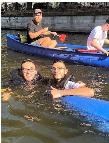
2 im Landwehrkanal....