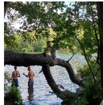
Chillen am See...