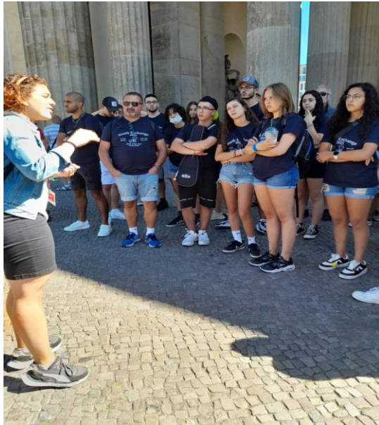
Stadtführung hier am Brandenburger Tor Olympiastadion...